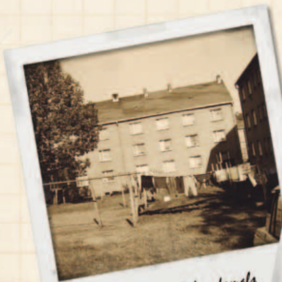
Bahnhofstr. 68 & 1c - damals