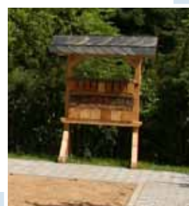
Insektenhotel, seit letztem Jahr neben dem Spielplatz Neue Straße 2