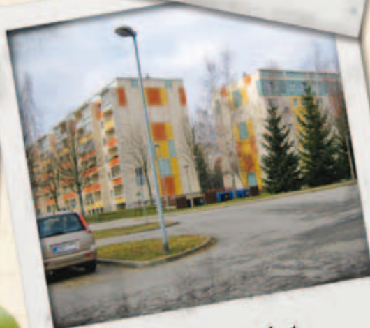
Goethestr. 63-79 - heute