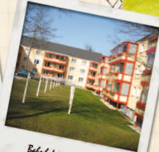
Bahnhofstr. 68 & 1c - heute