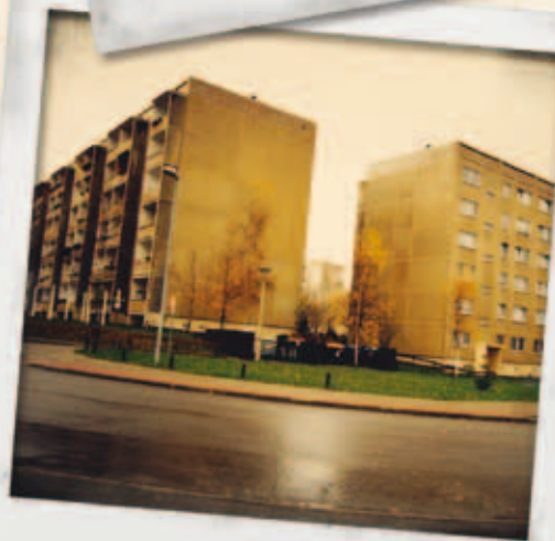
Goethestr. 63-79 - damals